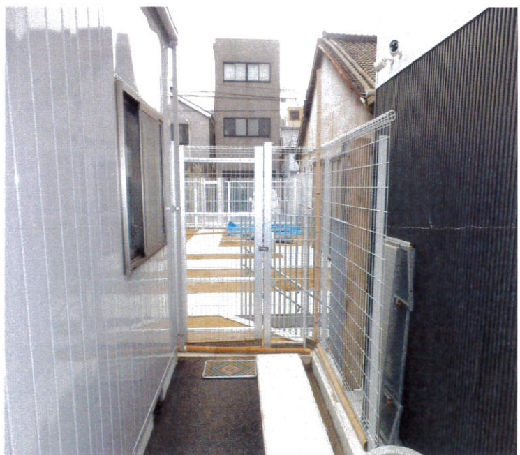
田島童園園庭フェンス増設工事