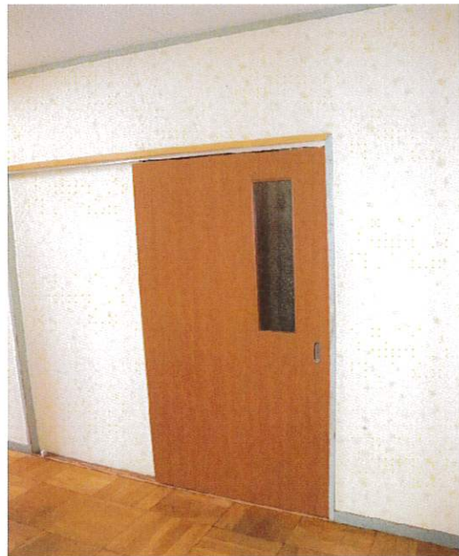
南館2階 あかしかホームベッド室扉