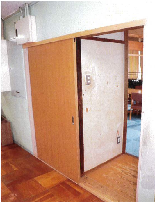
東館2階 多目的室会議室扉