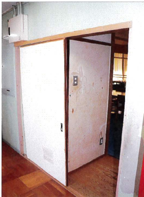
東館2階 多目的室会議室扉