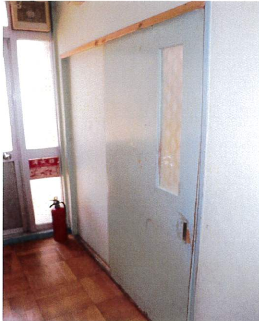
南館1階 くすのきホームベッド室扉