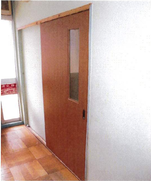
南館1階 くすのきホームベッド室扉