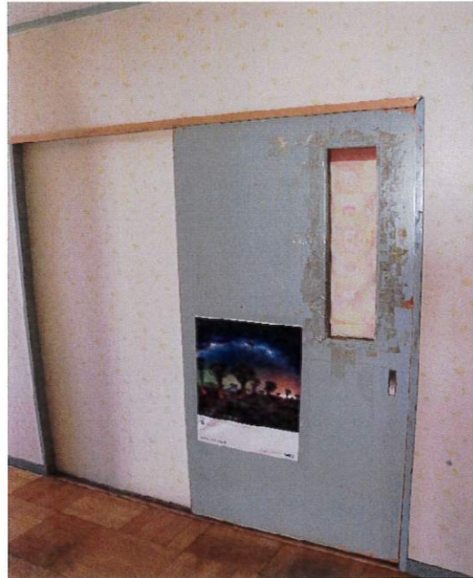
南館2階 あかしかホームベッド室扉